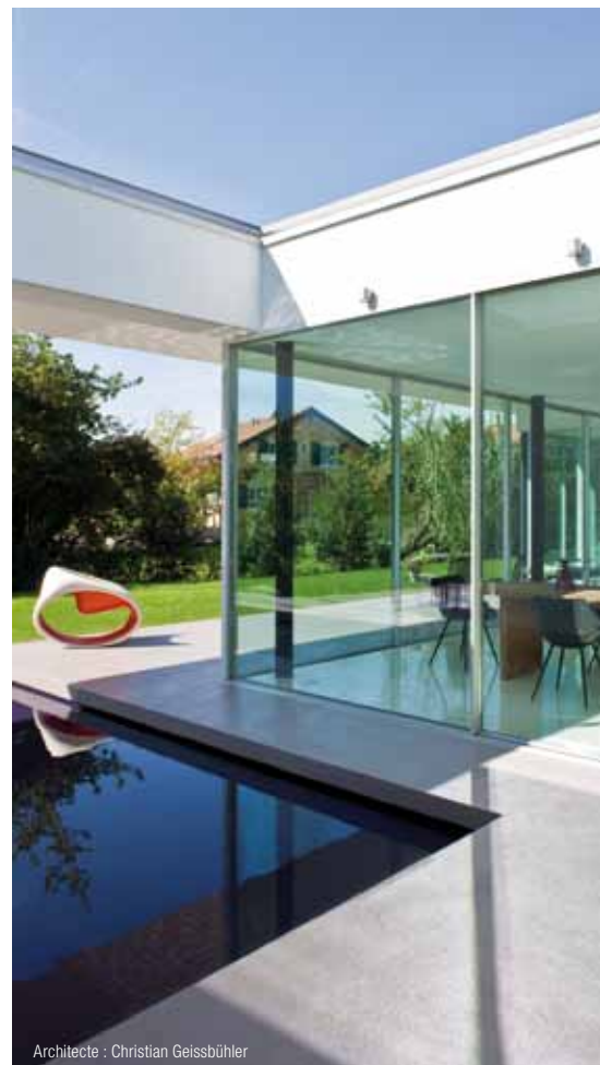
Architecte : Christian Geissbühler