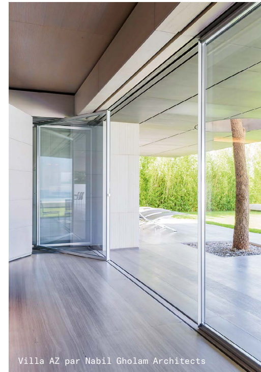
Villa AZ par Nabil Gholam Architects