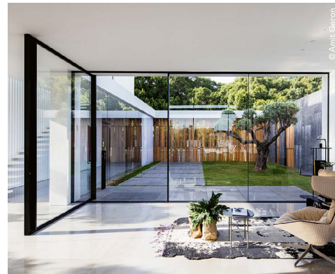
← ↑ F House par Pitsou Kedem Architects